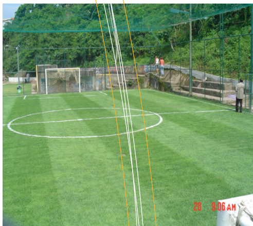
CAMPO DE CONDOMÍNIO EM CAMBOINHAS - NITERÓI - RJ