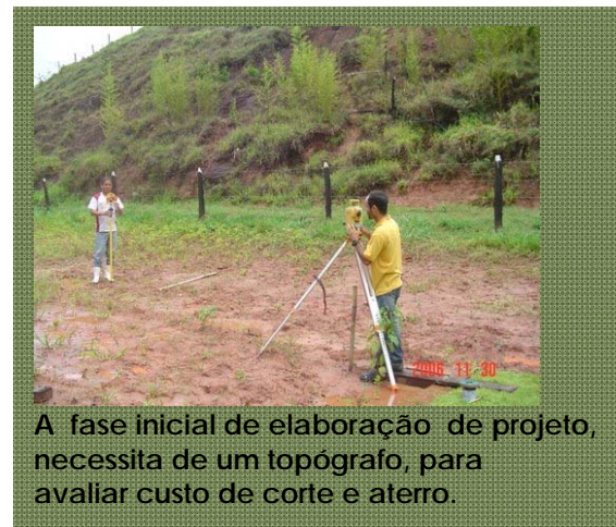
A fase inicial de elaboração de projeto, necessita de um topógrafo, para avaliar custo de corte e aterro.

O planejamento para implantação de um gramado tem várias etapas: Começamos definindo a espécie de grama a ser utilizada. Isso deverá ser definido em função do uso deste gramado. No caso ao lado, por exemplo, a grama escolhida foi a Zoyzia japônica (Esmeralda) e como em Manaus os dias são sempre quentes e com muito luz solar, esta variedade se adapta com muita facilidade porque seu crescimento será sempre intenso. Se fosse no sul do país esta variedade não seria possível para campos com jogos profissionais devido ao inverno rigoroso em que esta grama é submetida.