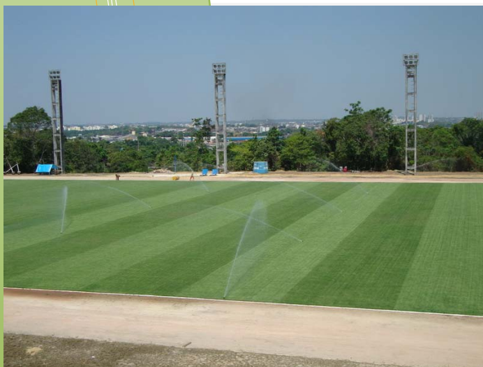
Campo oficial com irrigação automatizada SESC - AM