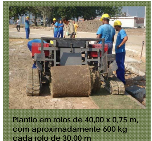
Plantio em rolos de 40,00 x 0,75 m, com aproximadamente 600 kg cada rolo de 30,00 m

O plantio de grama pode ser feito de várias formas, desde o plantio em plugs, até o plantio em rolos grandes (foto ao lado). A melhor forma de plantio irá depender de qual urgência este gramado ou campo esportivo deverá ficar pronto e qual plantio se encaixa em cada orçamento, pois o resultado final será o mesmo.