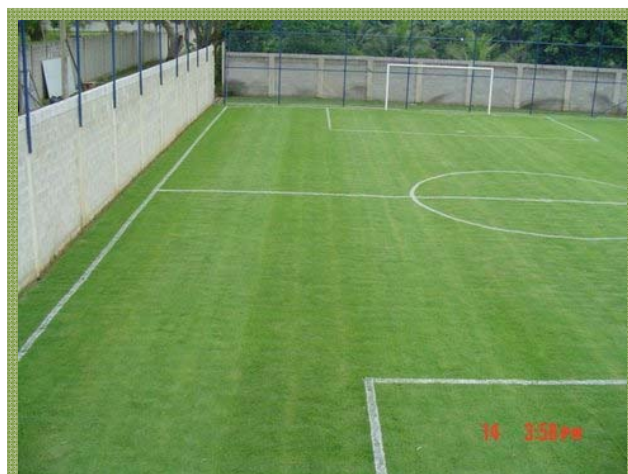
Sítio de lazer em Pedra de Guaratiba - RJ

Importante em qualquer trabalho é que se mantenha o padrão, pensando nisso o Chalé do Agrônomo trata um campo residencial da mesma forma que se trata de um campo profissional, utilizando toda tecnologia em gramados, com irrigação automatizada e drenagem, itens indispensáveis para um bom campo esportivo.