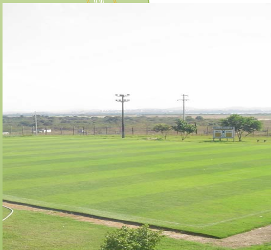
ANSEF – POLÍCIA FEDERAL DO RJ

O campo da ANSEF é utilizado pelos funcionários da polícia Federal do Rio de Janeiro, foi construído em 2000 e através da manutenção conseguimos obter um excelente campo até hoje.