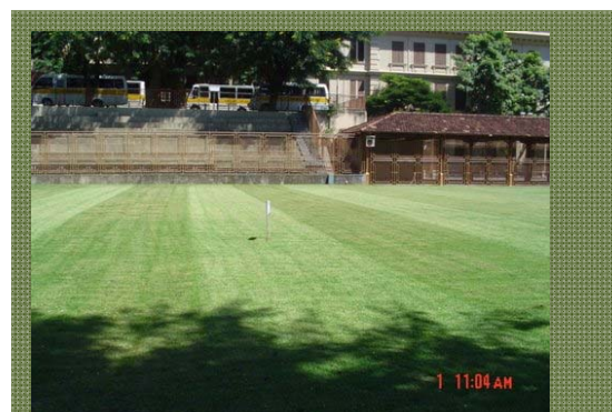
Vista ao nível do campo do Marista São José

O campo possui uma boa drenagem e conservação.